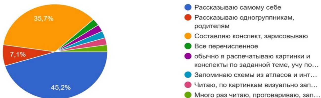
Рисунок 3. Как Вы запоминаете материал?

Диаграммы демонстрируют значимость дисциплины в образовательном процессе, а также необходимость по оптимизации учебного процесса для усвоения студентами материала практических занятий.