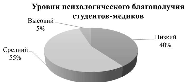
Рисунок 3 – Уровни психологического благополучия студентов-медиков

2. С необходимостью сложившейся ситуации, представленной в предыдущем пункте анализа, нами были изучены уровни психологического благополучия студентов-медиков. На рисунке 3, наглядное распределение количества респондентов по имеющимся у них уровням психологического благополучия.